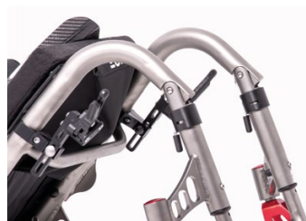
Snodo rapido, affidabile e autobloccante. Fast, reliable, self locking hinges.