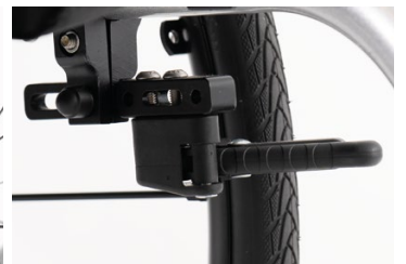
Freni composte (di serie) Composite brakes (standard)