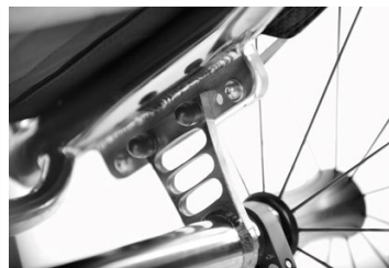
Baricentro fisso o regolabile Fixed or adjustable centre of gravity.