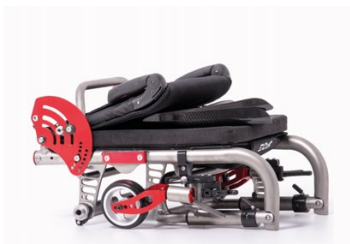
Minimo ingombro (piegata) Minimum volume (folded)

Alcune misure sono approssimate in base alle medie / Some measurements are averaged